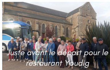
Juste avant le départ pour le restaurant Youdig

Le club "Au fil du temps" est heureux de vous accueillir les jeudis après-midis, toutes les quinzaines, pour diverses animations.