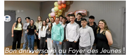
Bon anniversaire au Foyer des Jeunes !