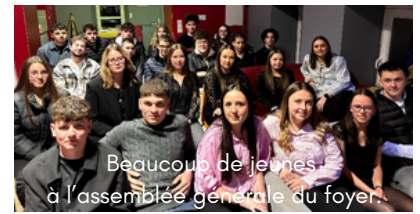
Beaucoup de jeunes à l'assemblée générale du foyer.

Le 18 avril, le Foyer des Jeunes a fêté ses 45 ans : toutes les générations se sont retrouvées, autour d'un verre de l'amitié puis d'un bon repas. Bonne continuation au Foyer !